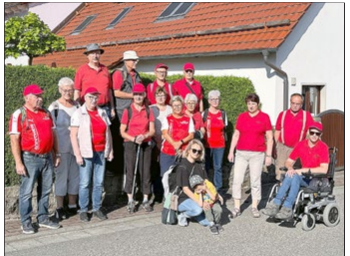
Ein Teil der Wanderfreunde Gernrode welche die blaue Route gewählt hatten